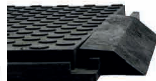
Remopla mit Anfahrtsrampe